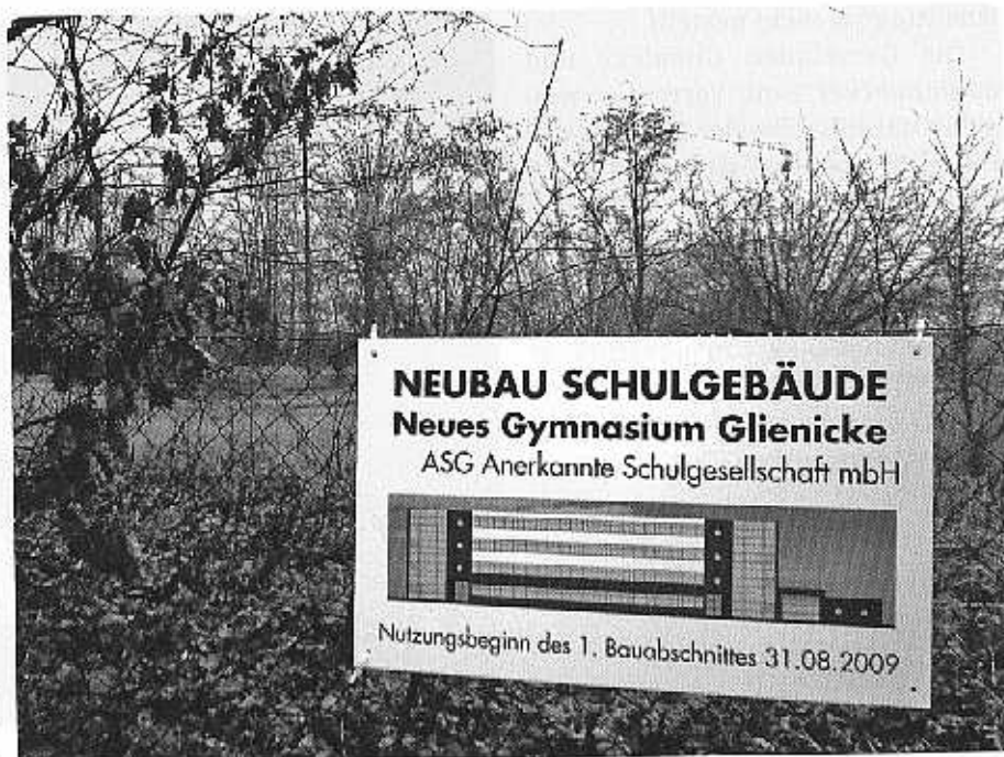
Am Zaun des Baugrundstücks hängt inzwischen ein Hinweisschild.

Elmar Süß versuchte zu beruhigen: „Es ist gesichert, dass die Kinder am 1. Schultag in einem Neubau unterrichtet werden.“ Verzögerungen hatte es im Vorfeld gegeben, da der Träger zunächst einen das Grundstück betreffenden Unbedenklichkeitsbescheid aus dem Umweltamt abwarten wollte. Auch die Frage des Investors konnte bisher nicht ab-