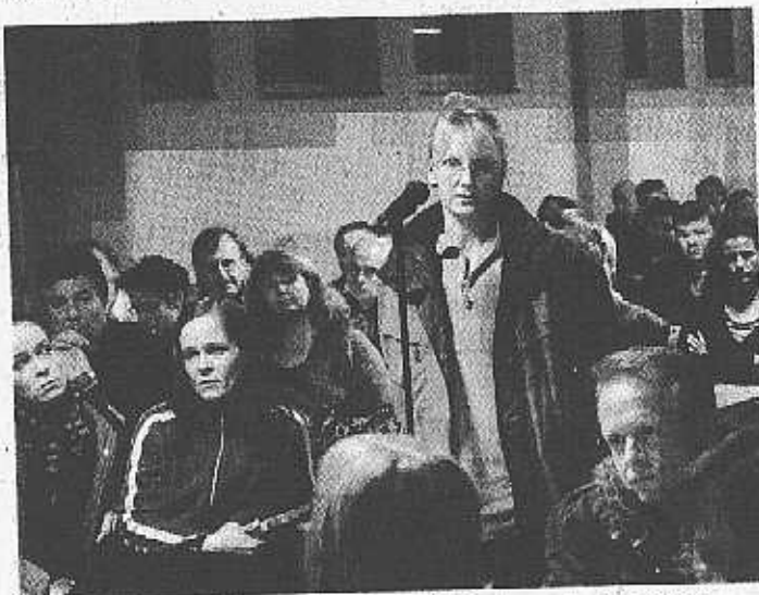
Besorgte Eltern äußerten Zweifel und forderten sofortige Taten.

Unter dem wachsenden Druck sicherte Eimar Süß dann zu, den Kaufvertrag in der nächsten Woche zu unterzeichnen, selbst wenn der ASG dadurch Nachteile entstünden. Auch das Schild auf dem Grundstück soll nun von einem anderen ersetzt werden: „Hier baut die ASG“.